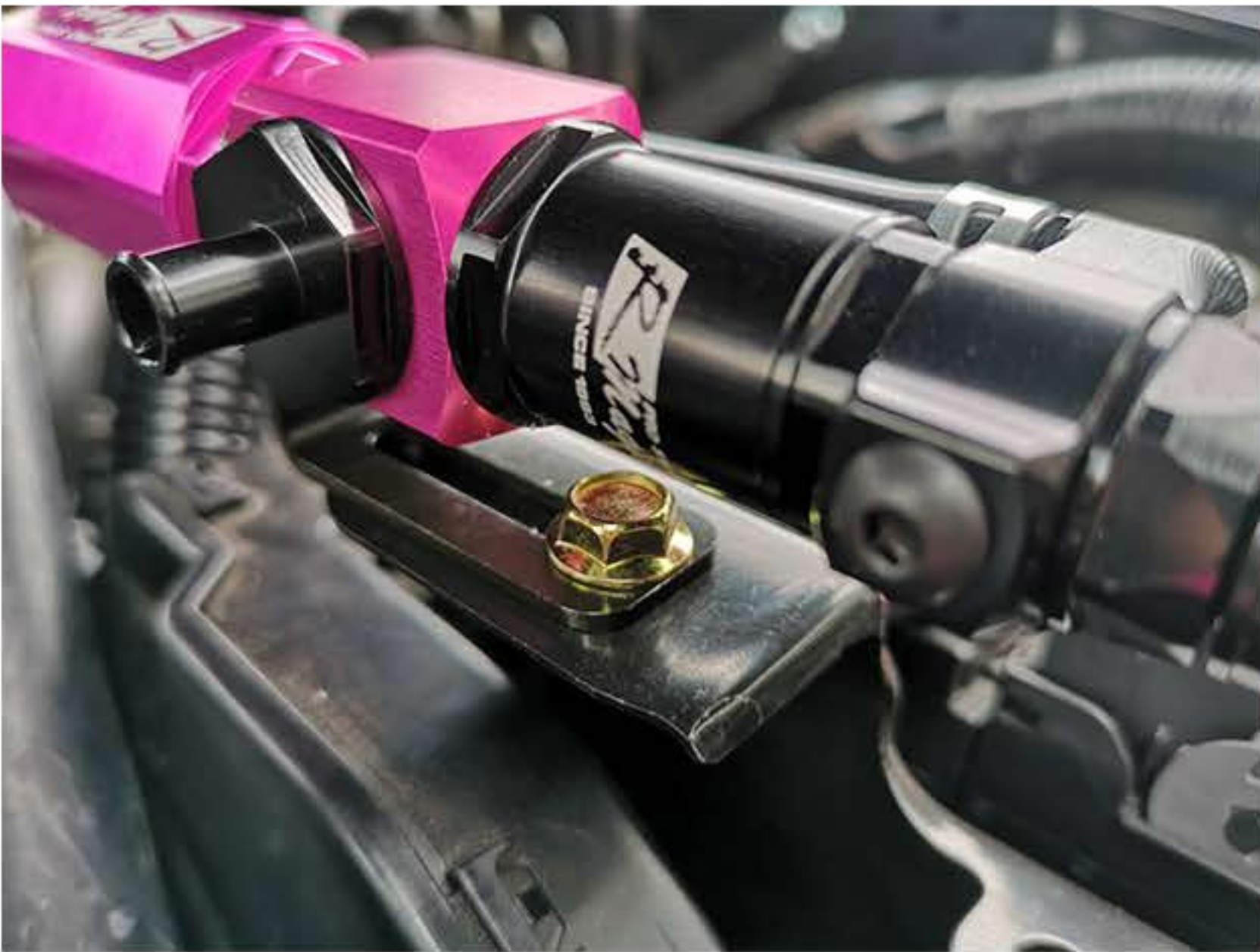
付属のM6ボルトで本体を固定してください