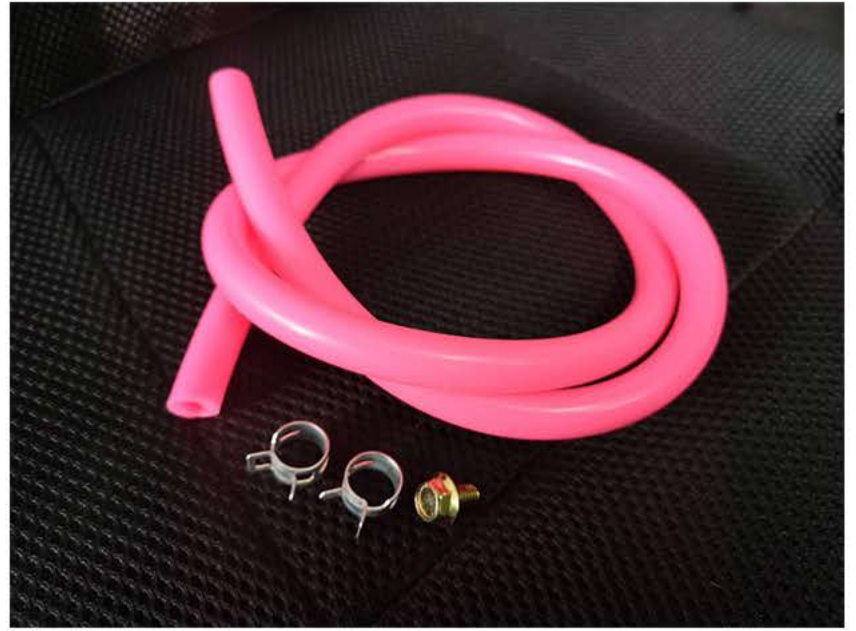
付属品はホースクランプ×2個、M6×10フランジボルト、シリコンホース(約80cm)