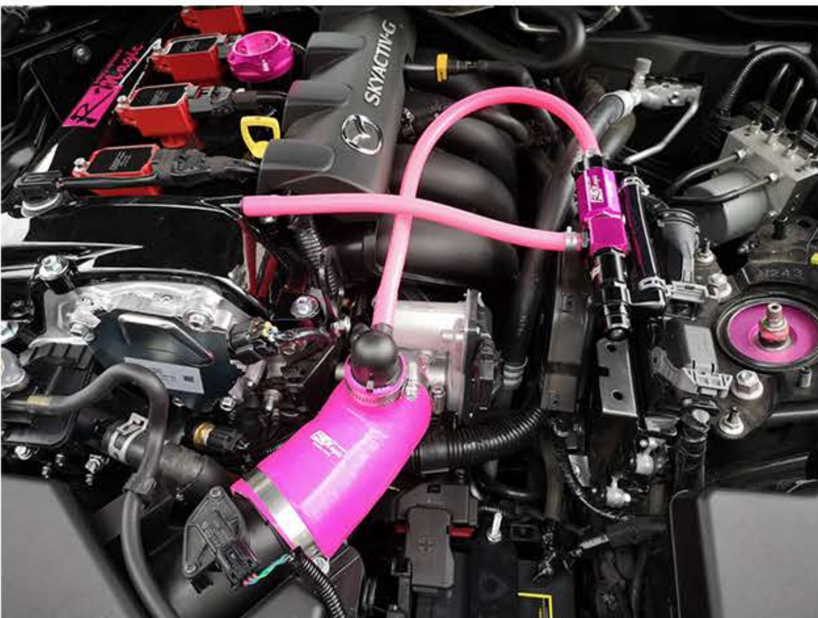
付属のホースを適当な長さに切って配管してください