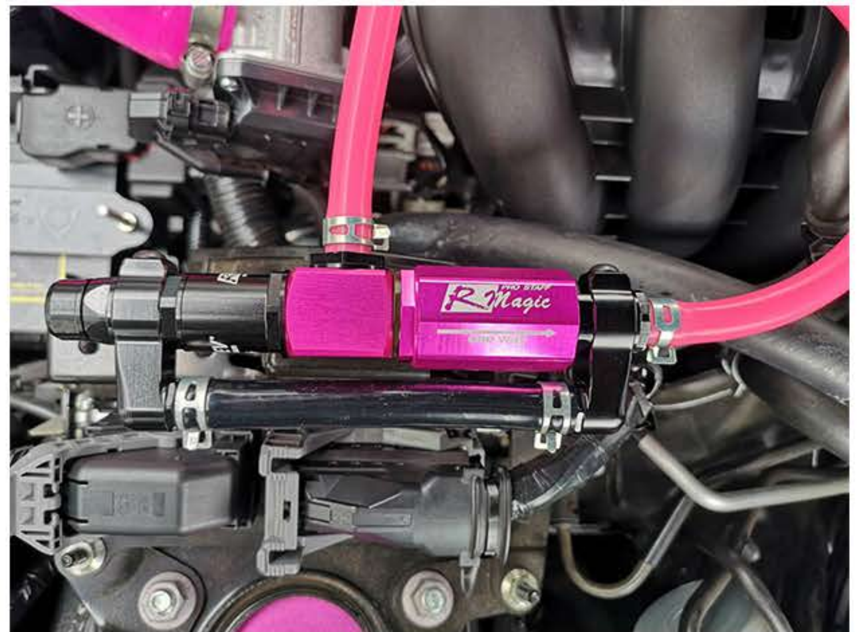
ホースクランプはT-REV BP側だけで十分です