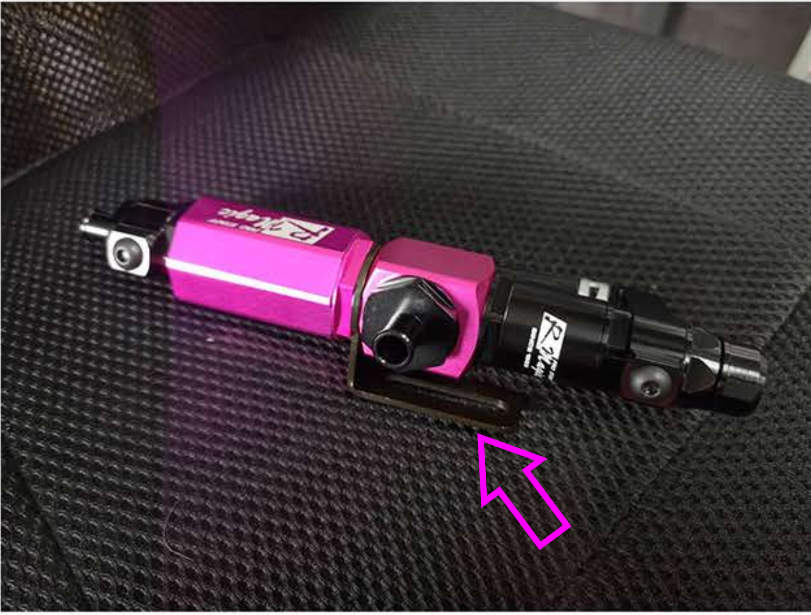
取り付けステーは本体にセットしてあります